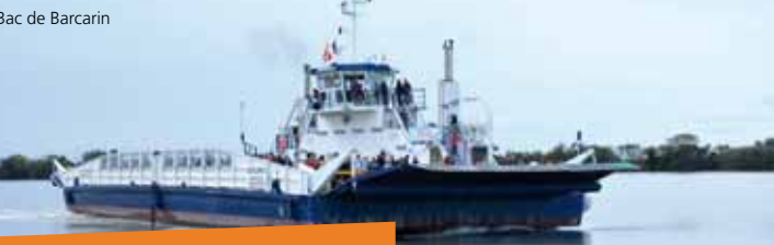
Bac de Barcarin