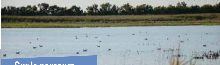
The Vaccarès Pond

Attention, veuillez consulter la météo avant de partir et éviter de randonner par temps de mistral